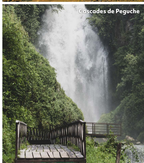
Cascades de Peguche