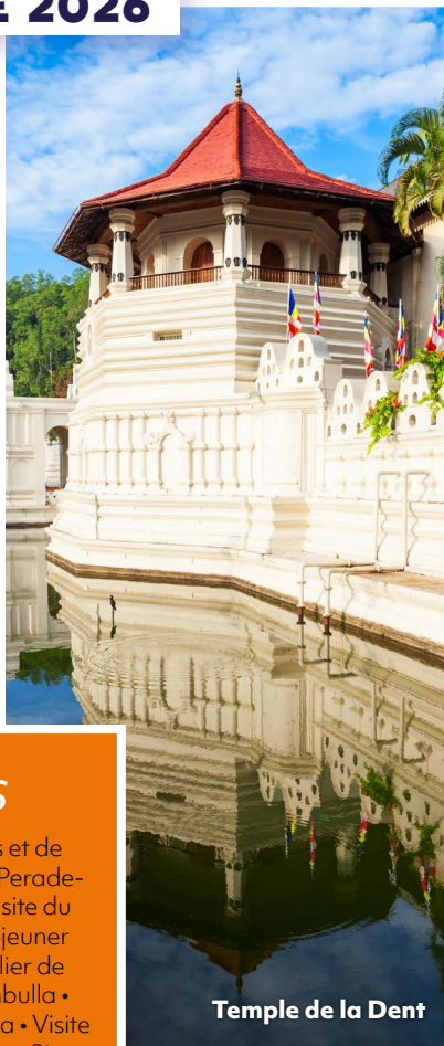
Temple de la Dent